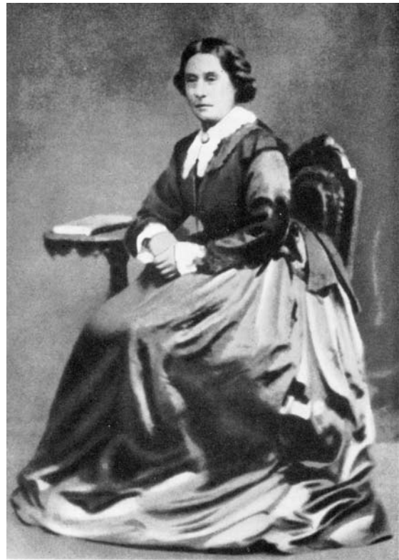
Jenny Marx in den letzten Lebensjahren, eines der nur vier überlieferten Fotos von ihr